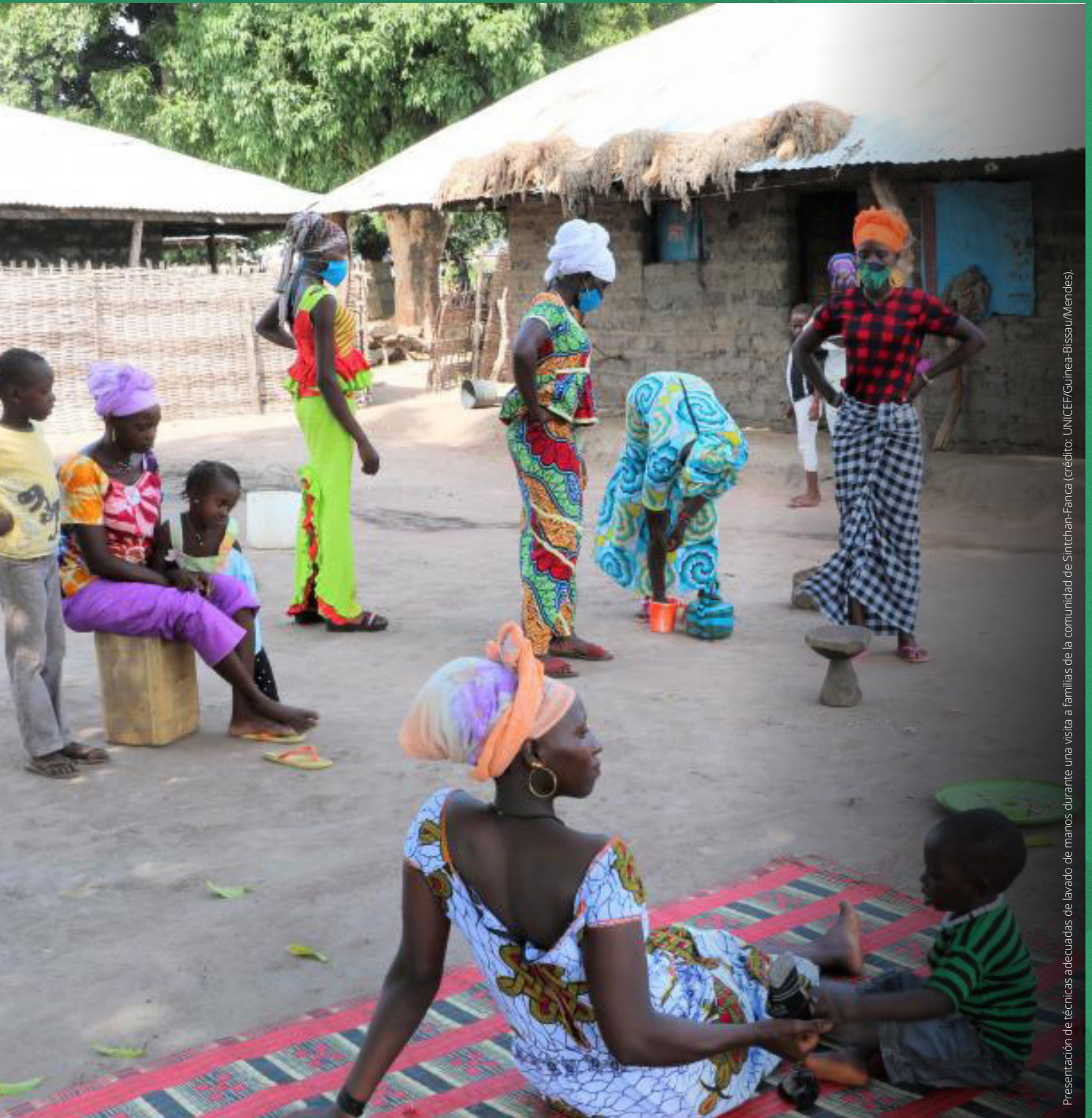
Presentación de técnicas adecuadas de lavado de manos durante una visita a familias de la comunidad de Simtchan-Fanca.